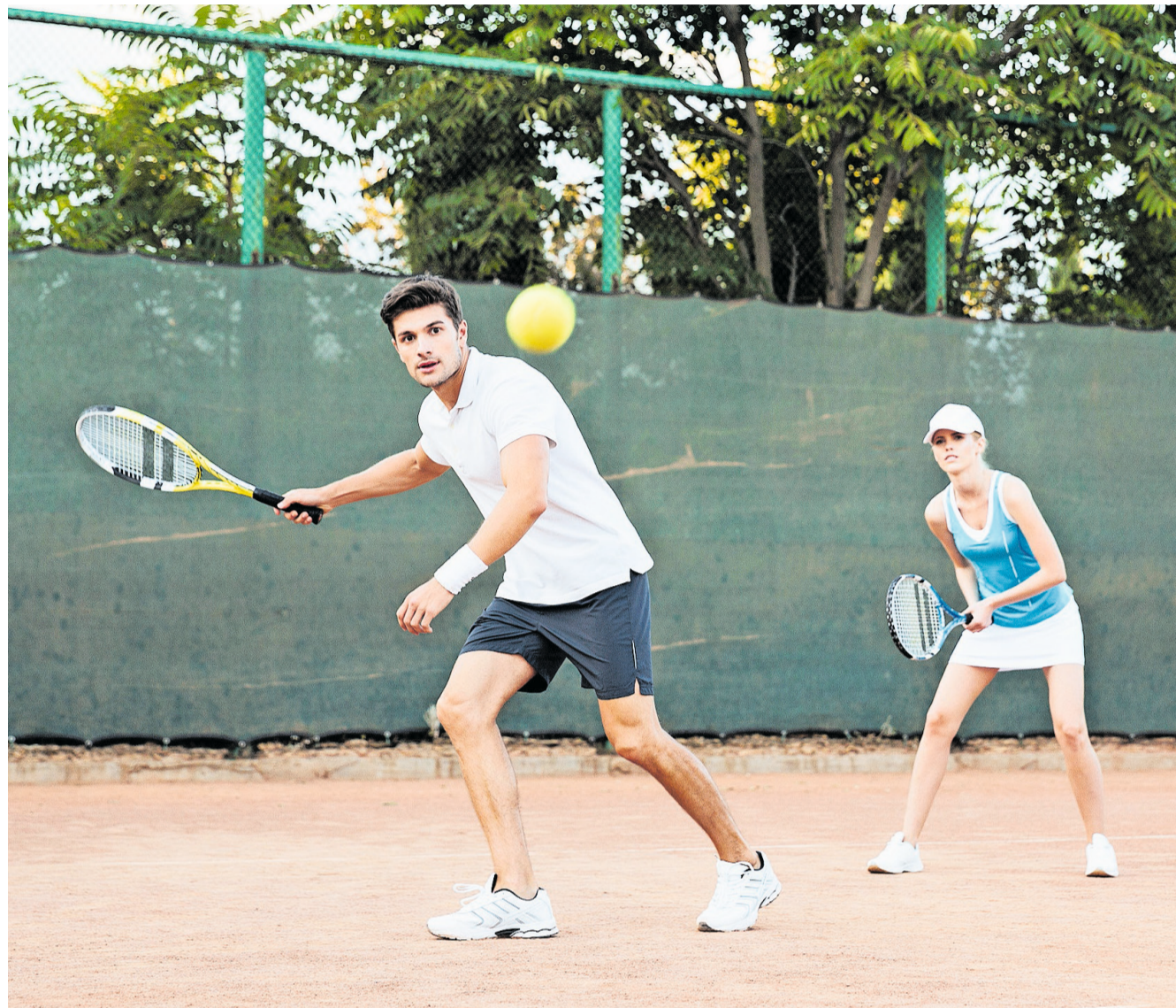
Nur wer den richtigen Einstieg in den Tennissport findet, hat Freude daran.